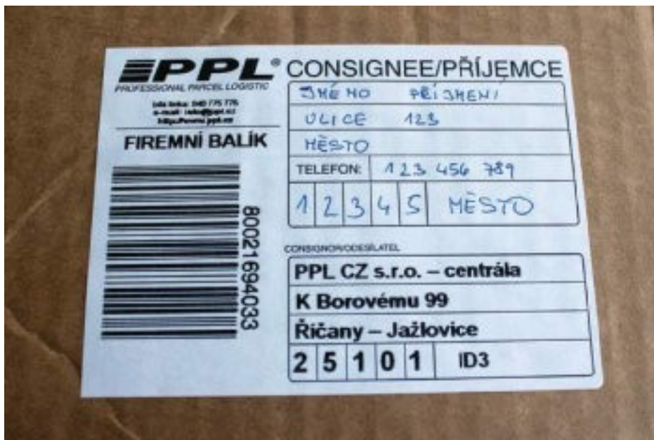
Fotografii adresního štítku přepravce