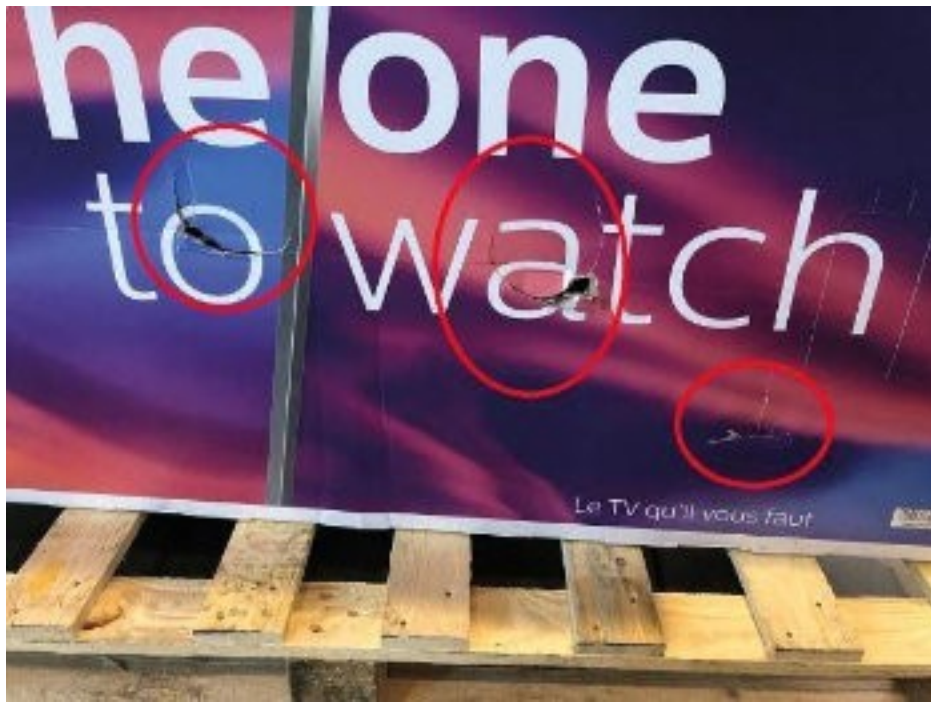
Fotografii poškození obalu